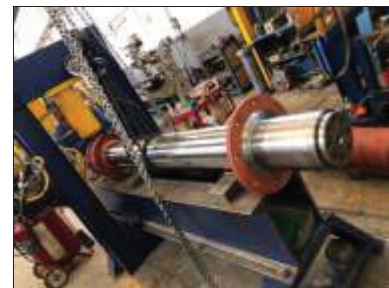
Equipo para rectificados, Bruñidos, Prensa y Soldadura.