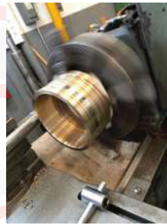
Tornos de precisión