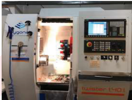
Generadora Austriaca Mod.T40L

Contamos con maquinaria europea de última generación para la fabricación moderna de sellos y empaques con materiales de alta tecnología para variedad de aplicaciones.