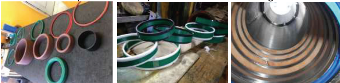
Resistentes a altas temperaturas / fricción / Agua glicol / Presión y Varios contaminantes agresivos.